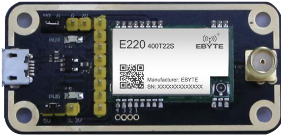
如图所示，插接好跳线帽（选择 5V 供电，模式 2），具体功能请参照相应的串口模块手册。