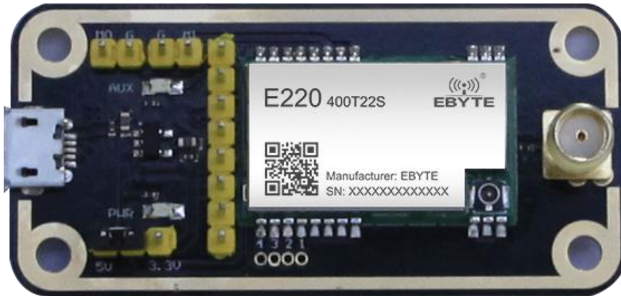
如图所示，插接好跳线帽（选择 5V 供电，模式 3），具体功能请参照相应的串口模块手册。