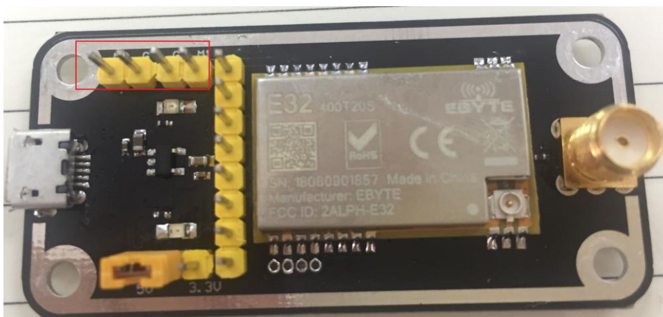
如图所示，插接好跳线帽（选择 5V 供电，模式 3），具体功能请参相应的串口模块手册。