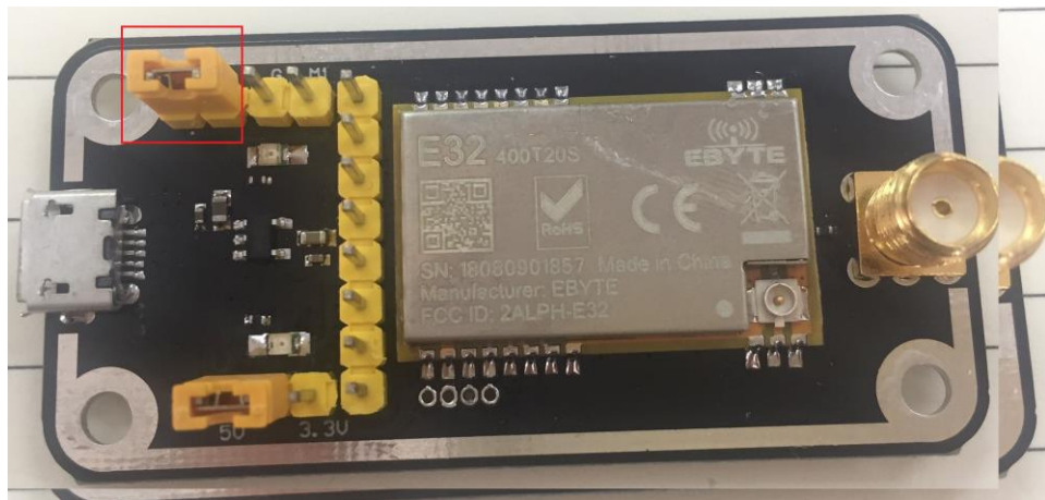
如图所示，插接好跳线帽（选择 5V 供电，模式 2），具体功能请参相应的串口模块手册。