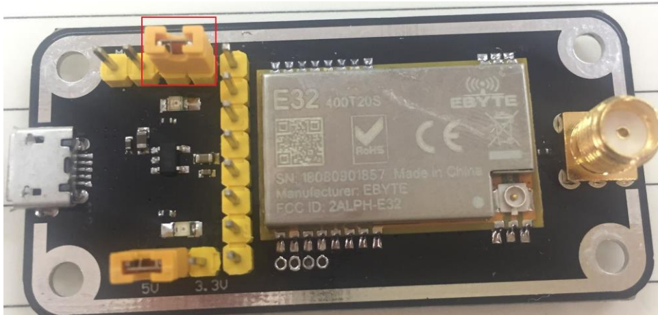
如图所示，插接好跳线帽（选择 5V 供电，模式 1），具体功能请参相应的串口模块手册。